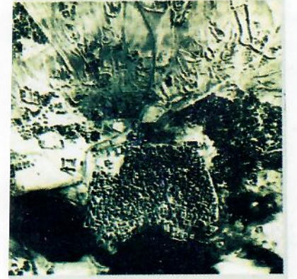
جدة عام ١٩٤٧م مساحة ١ كلم ٢

جدة مدينة قديمة وعريقة في التاريخ .. ومنذ انضوائها تحت لواء الموسس الملك عبد العزيز بن عبدالرحمن آل سعود طيب الله ثراه وهي تسير بقوة في التطوير والتحديث مع الحفاظ على عمارتها التقليدية .. وقد أنشئت حكومة خادم الحرمين الشريفين الملك فهد بن عبدالعزيز يحفظه الله العديد من المشاريع الخيرة لتحسين وضع المنطقة التاريخية .. كما انشئت ادارة مختصة لحماية ورعاية المنطقة التاريخية .. وبدأ العمل في مشروع صاحب السمو الملكي الأمير ماجد بن عبدالعزيز لرعاية وتأهيل المنطقة التاريخية ، والمنطقة غنية بالمواقع المهمة مثل مصلى ومسجد الملك عبد العزيز ، بيت نصيف ، المسجد الجامع العتيق، مسجد عثمان بن عفان ، وعين فرج يسر .. والعديد من المباني العامة والخاصة ..